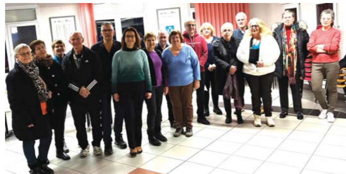
Réception en mairie des bénévoles œuvrant pour la Banque alimentaire.