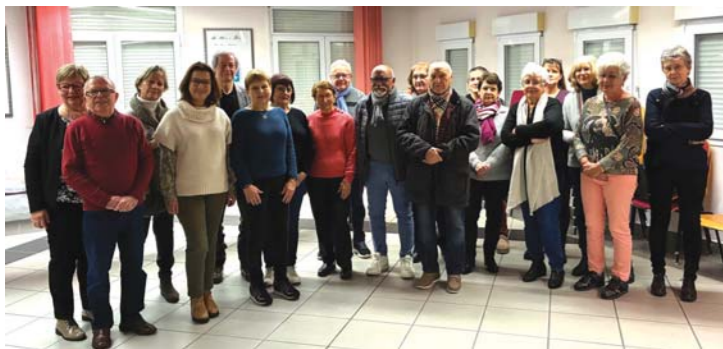
Réception en mairie des bénévoles œuvrant pour la Ligue contre le cancer.