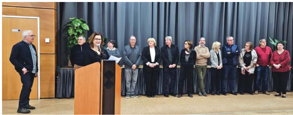
Cérémonie des vœux.