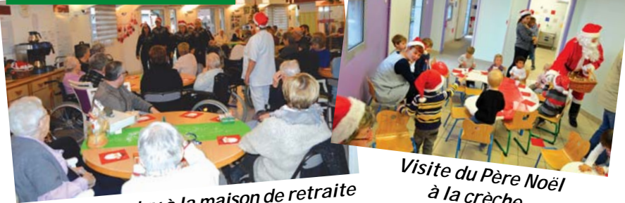
Ambiance country à la maison de retraite «Les Soleils» pour la fête de Noël.