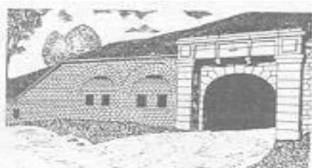
Association «Le Mont-Bart»

Contact: Maison pour tous – Tél : 03.81.92.64.25