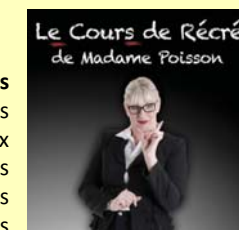
Le Cours de Récré de Madame Poisson

Attention : 20 places maxi - les inscriptions sont de mises pour y participer !