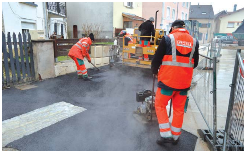
Fin des travaux de la Place centrale.

Le projet de couverture d'un court de tennis a été validé après consultation des élus, de l'association du Tennis-Club de Bavans et du maître d'œuvre. La solution retenue est de type structure arquée en bois lamellé collé avec bardage PVC haute résistance. Les dossiers de consultation des entreprises en cours permettront d'engager les travaux début avril 2020.